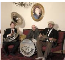
Los Torpedos